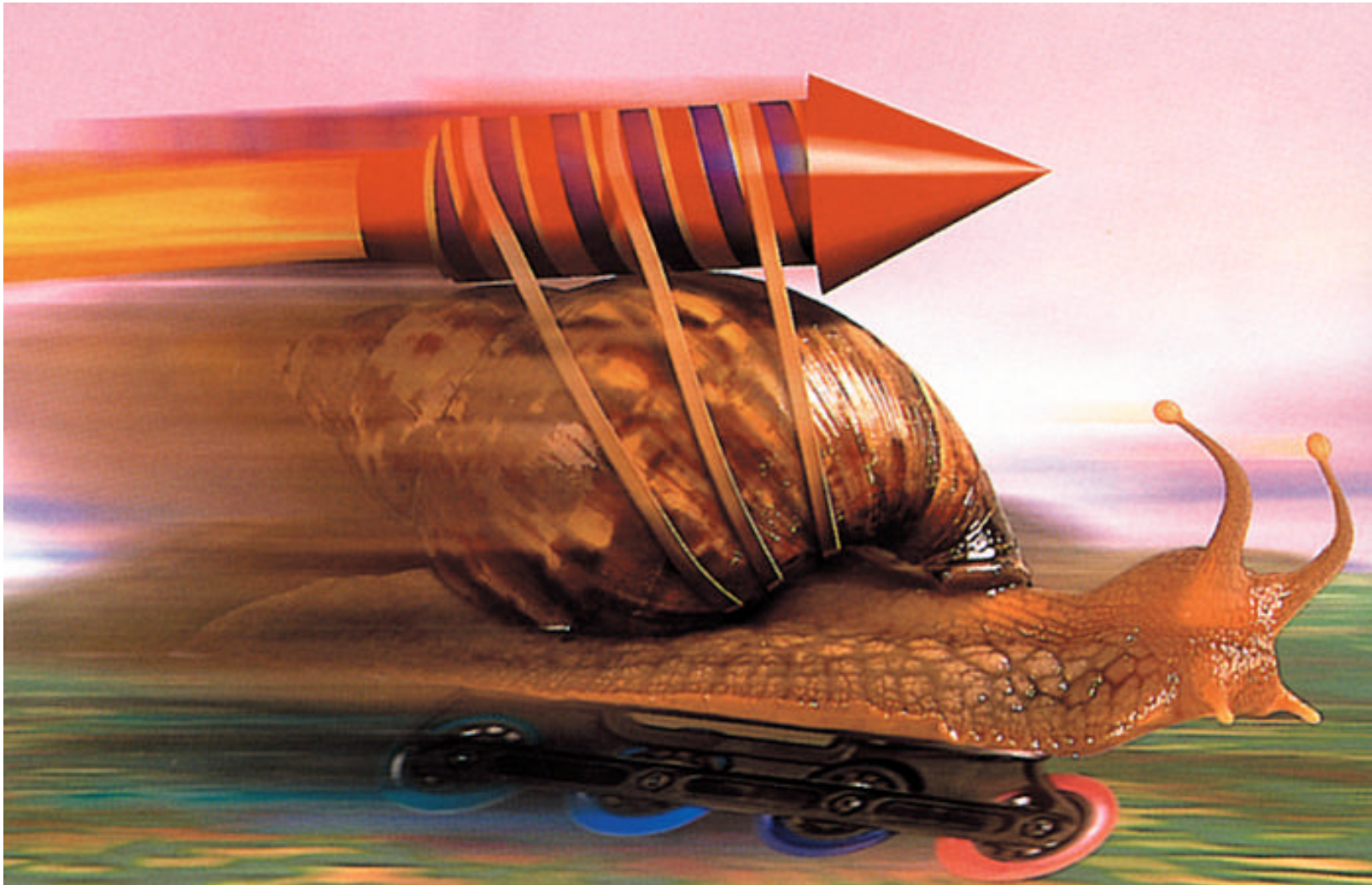
Immagine "rubata" ad Hitachi Data Systems.